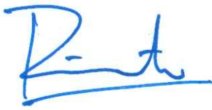
មេធាវី ធីង ពុទ្ធារិទ្ធ Thoeung Putharith