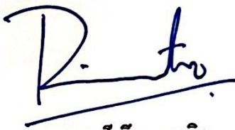
មេធាវី ធីន ពុទ្ធវិទ្ធី Thoeung Puthearith