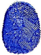
ប្រុត ថា Prut Tha