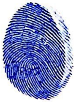
ប្រប់ តុច Brop Tuch