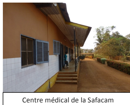
Centre médical de la Safacam

Auparavant, l'ensemble de personnes atteintes du VIH-SIDA qui nécessitaient un suivi dans une structure externe, étaient référées à Douala. Depuis 2013, tout nouveau cas identifié est référé à l'Hôpital Régional d'Edéa, structure de confiance pour le suivi des patients, dans un environnement plus proche de la plantation.