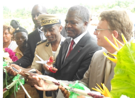
Cérémonie de rétrocession de la case de santé de Koungué Somsé en présence du Préfet de la Sanaga Maritime et du Directeur Général Adjoint, de la Safacam.