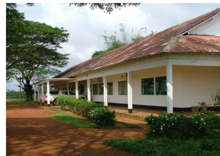
Direction Générale de la Safacam

Augmenter le taux de féminisation des postes, comme inscrit dans la charte des droits de l'Homme, est au centre du processus de recrutement de la Safacam. Ainsi en 2014, on note une augmentation de 65 % de l'effectif des femmes par rapport à l'année 2013.