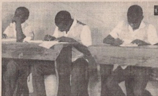
Pour une meilleure intégration sociale.

Présenté comme étant un réel centre de formation professionnelle qui accueillera ces jeunes pour un cycle de 3 ans d'autant que les élèves se verront dispenser tant une formation générale du niveau 6ème/5ème qu'une formation pratique, l'Efa a plusieurs spécificités. « La formation par alternance qui alterne 15 jours de cours théoriques et pra-